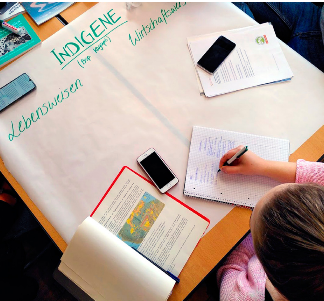
Ideenklau für meine Welt